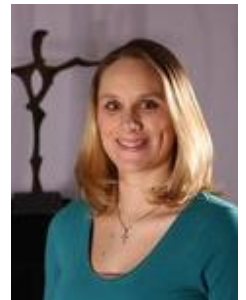
Leitung: Claudia Eisinger